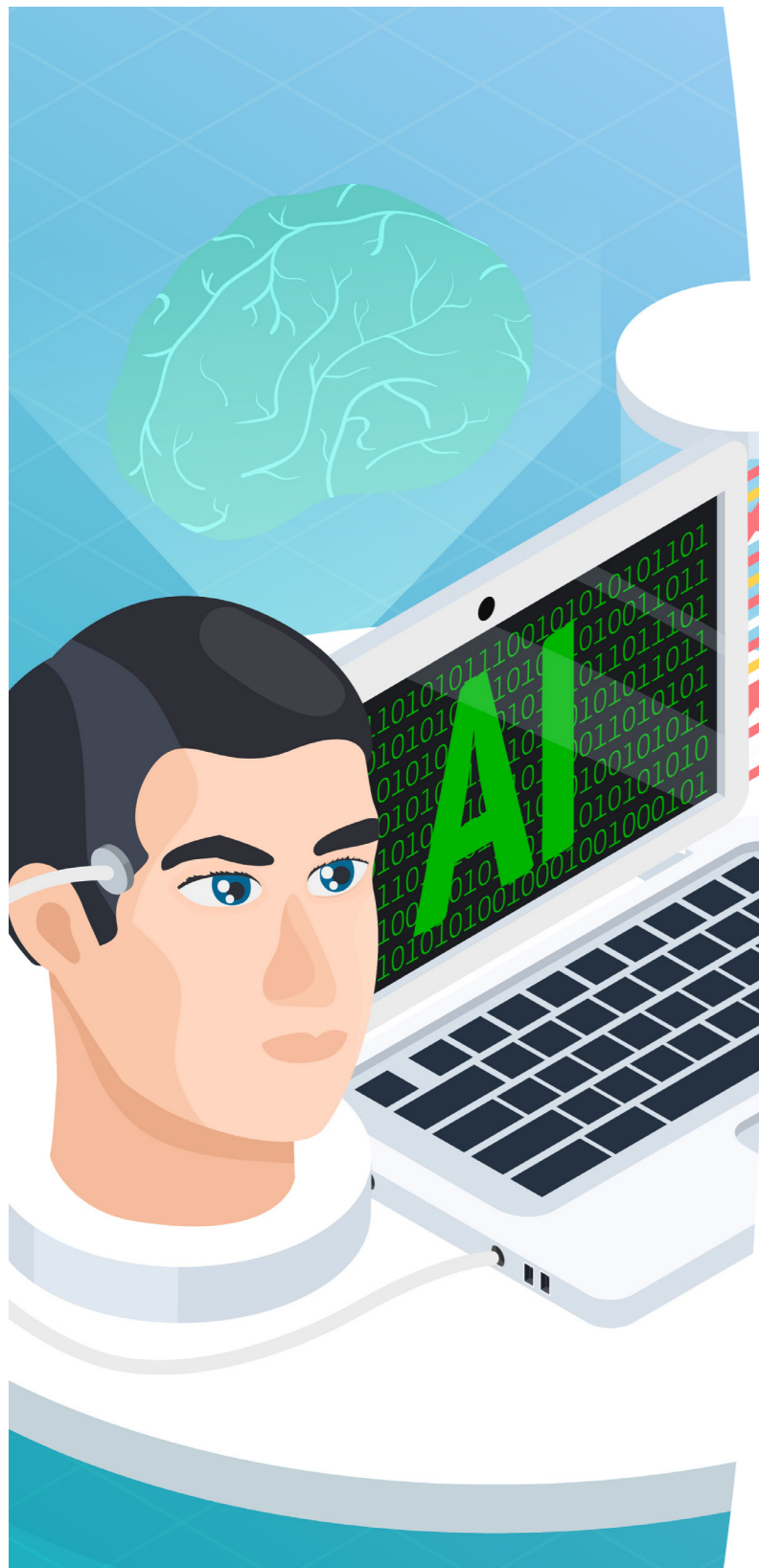
Figura 1. Desafío de la IA contra la evaluación tradicional